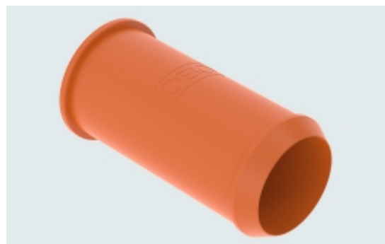
Slika 11. Spojni podaljšek tip ZH 11-V