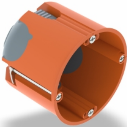
Slika 9. Doza za votlo steno tip HG 61-L

Novi program doz za suho gradnjo nudi številne pomembne prednosti na gradbišču. OBO-ve doze za votlo steno so dostopne kot vgradne doze, vgradne razdelilne doze, doze za elektroniko in doze za izvod kabla – in sicer kot standardne ali zrakotesne različice! Ponudbo dopolnjuje nabor dodatkov, ki močno olajša montažo električnih instalacij med suho gradnjo, z zagotovljenimi rezultati. Popolnoma preoblikovan in razširjen program vsebuje številne patentirane funkcije in dobro oblikovane podrobnosti izdelka, ki zagotavljajo še učinkovitejšo in varnejšo instalacijo kablov in cevi.