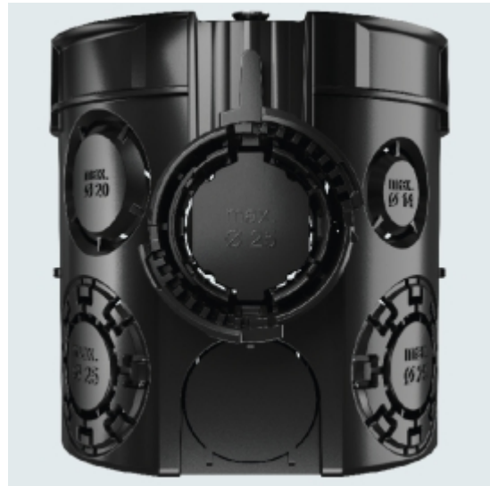
Slika 5. Vhodi za kable in cevi

Vse doze imajo označene vhode za kable in cevi. Standardne doze imajo sodobne kombinirane vhode za cevi premera M20 in M25. Material se prilagaja velikosti cevi, medtem ko vglavni jezički zagotavljajo trdno povezavo. Montažne cevi je mogoče vstaviti iz različnih smeri do velikosti M25.