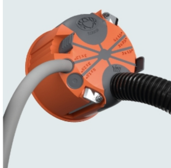
Slika 12. Zrakotesna doza za votlo steno tip HG 47-