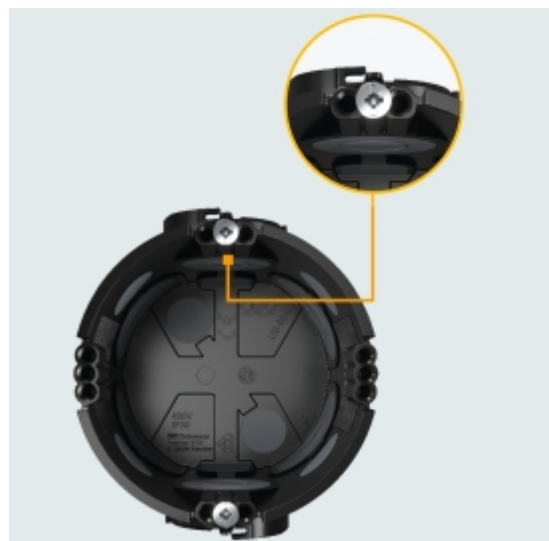
Slika 6. Mesta za poravnavanje elektroelementov

4 x 3 je formula za poravnavanje elektroelementov: 4 pozicije s 3 odprtinami omogočajo natančno poravnavanje in natančno pritrdjevanje elektroelementov – tudi v primeru neuspešnega ometavanja. Diagonalno nameščene luknje ohranjajo standardno razdaljo 60 mm.