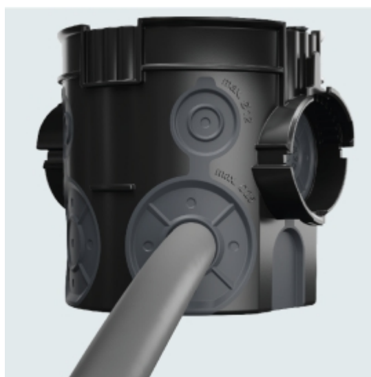
Slika 8. Zrakotesna doza UG 66-L