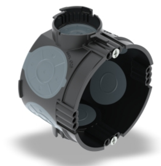
Slika 7. Zrakotesne doza UG 46-GS-L

so zrakotesne podometne podlage s termoplastično elastomerno (TPE) membrano. Zrakotesne doze preprečujejo pretok zraka med steno in notranjostjo stanovanja ter s tem toplotne izgube. Primerne so predvsem za zidane stene z votlimi prostori, kot je votla in perforirana opeka. Zaradi električnih inštalacij se lahko v opečnih komorah ustvari učinek kaminov, ki ga zanesljivo preprečujejo nepredušne podometne doze. Zrakotesne različice podometnih doz OBO, razen kombiniranih vhodov, imajo enake lastnosti kot standardne podometne doze.