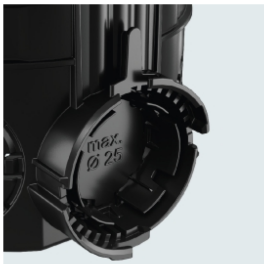
Slika 4. Podaljšek spojke

Edinstvena lastnost podometnih doz OBO je povezava s patentiranim vrtljivim zaklepanjem. Spojni podaljšek se nahaja na obeh straneh doz ter zagotavlja maksimalno prilagodljivost in hitro instalacijo. Podometne doze so trdno povezane z majhnim obratom in so z zvokom »klik« pripravljene na vsako situacijo. Pri tem se stalno ohranja normirana oddaljenost od središča doze v razdalji 71 mm.