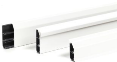
Slika 3. Izvedbe instalacijskega kanala SL

Instalacijski kanal SL je dostopen v treh velikostih in treh različnih izvedbah: