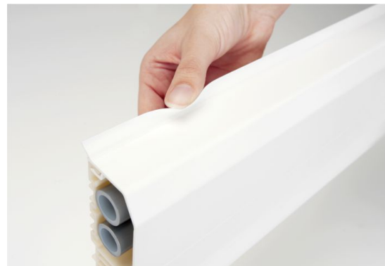
Slika 13. Pokrov kanala s tesnilom RDL OT

Tako kot pri instalacijskem kanalu SL se tudi montažna ohišja nameščajo kjer koli na kanalu RAUDUO po načelu modularnega sistema, sistem pa je prilagojen za vgradnjo standardnih električnih elementov skoraj vseh proizvajalcev. Instalcijski kanal RAUDUO je na voljo v naslednjih barvah: RAL 9001 krem bela in RAL 9010 bela.