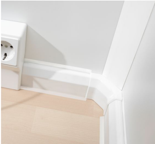
Slika 8. Povezava kotnega in instalacijskega kanala