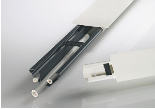
Slika 7. Kotni kanali tipa ECK by OBO