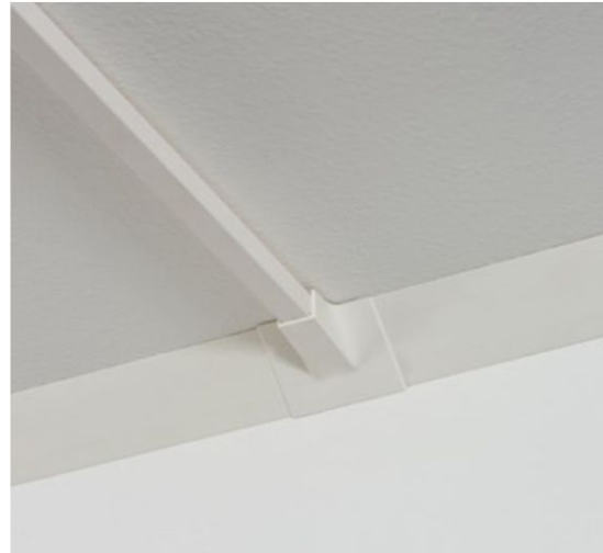
Slika 9. Stropni odcep