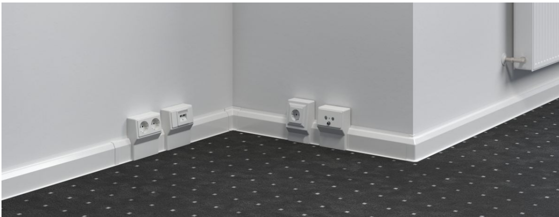
Slika 2. Končana instalacija z instalacijskim kanalom SL