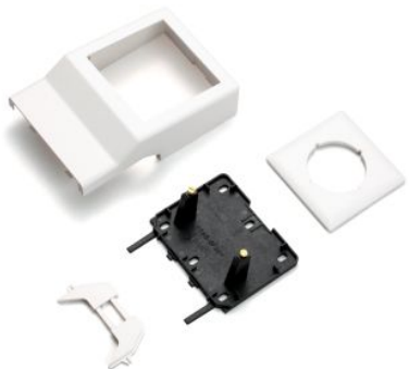
Slika 4. Prazno ohišje SL ETI