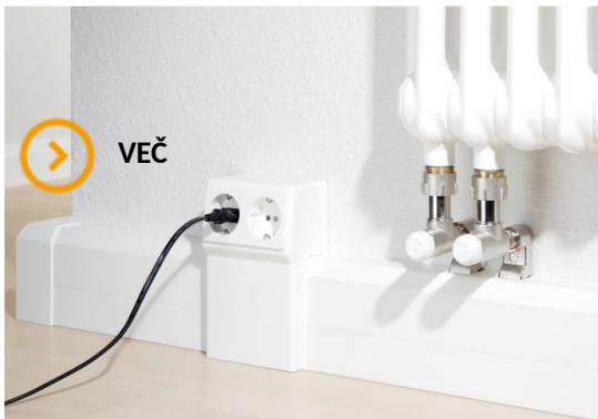
Slika 12. Rauduo z dvojno priključnico