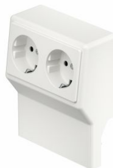
Slika 5. Opremljeno ohišje SL 2GT