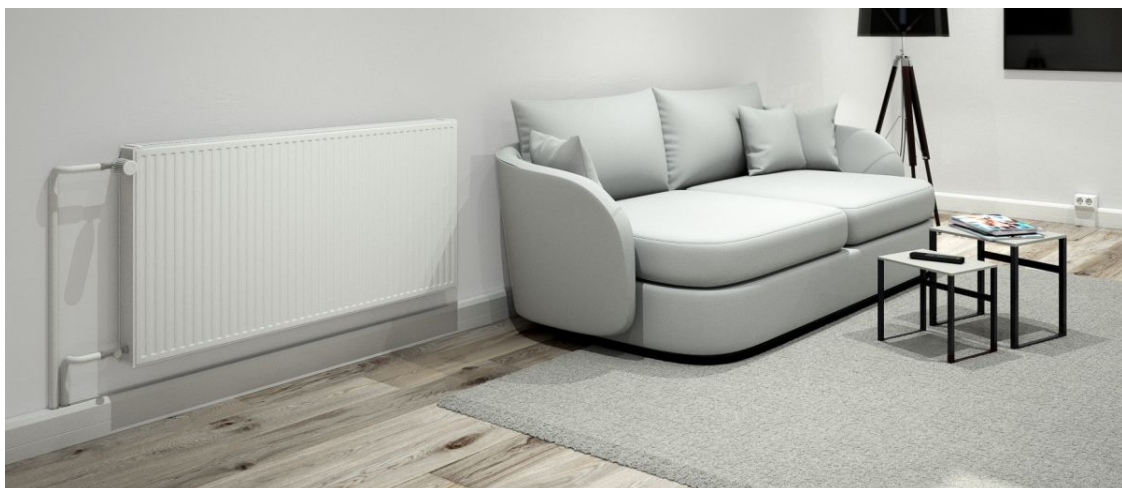
Slika 14. Končana instalacija s pomočjo kanala Rauduo