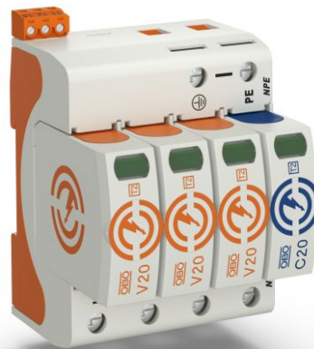
Slika 5: V20-3+NPE+FS-280, št. art. 5095333