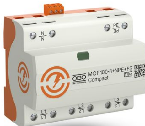
Slika 3. MCF100-3+NPE+FS, št. art. 5096987

Ti odvodniki so bili razviti za univerzalno uporabo v objektih za zaščito pred strelo I - IV in imajo skupno izpustno zmogljivost do 100 kA (25 kA/pol). Naprave se uporabljajo v stavbah z zunanjo zaščito pred strelo ali pri nadzemnih električnih napeljavah. Poleg pisarn, poslovnih stavb in stanovanjskih zgradb so te naprave primerne tudi za industrijo.