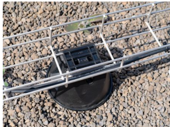
Slika 13. Končana montaža