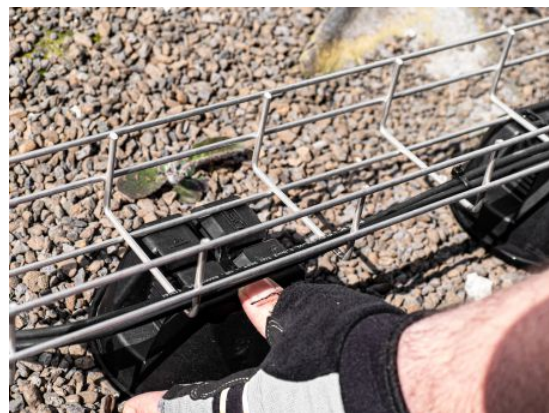
Slika 11. Polaganje nosilcev pod mrežno polico