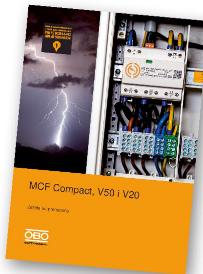
Odvodniki prenapetosti MCF, V50 in V20