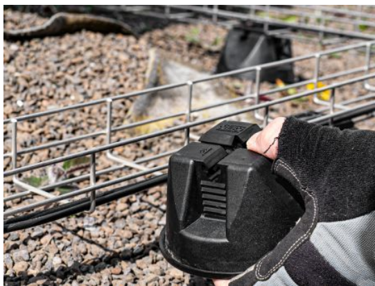
Slika 10. Nosilec strešnih instalacij 165 MBG