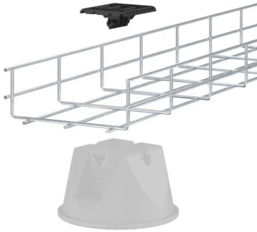
Slika 9. Montaža adapterja na nosilec strešnih instalacij 165 MBG

Adapter je posebej razvit za mrežne police OBO GR-Magic® v kombinaciji s strešnim nosilcem 165 MBG . Adapter se preprosto pritrdi na nosilec strešnega nosilca in rahlo pritisne. Sistem pritrditve na klik omogoča hitro in preprosto namestitev adapterja brez orodja, s čimer se znatno skrajša čas namestitve, podobno kot sistem mrežnih polic s priključnim sistemom GR-Magic®, ki ga je razvil in patentiral OBO.