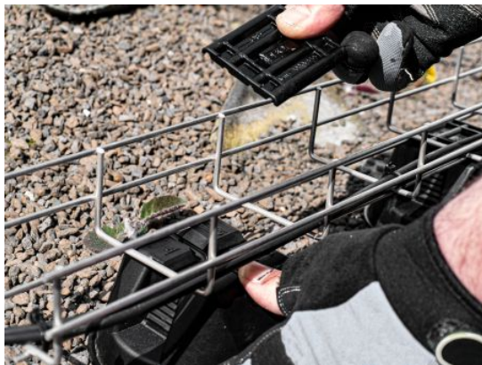
Slika 12. Pritrditev adapterja