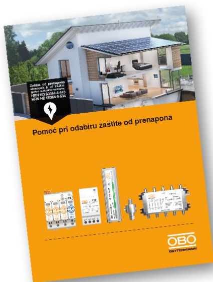
Pomoč pri izbiri odvodnika prenapetosti

Prenesite najnovejše brošure, povezane s trenutno temo!