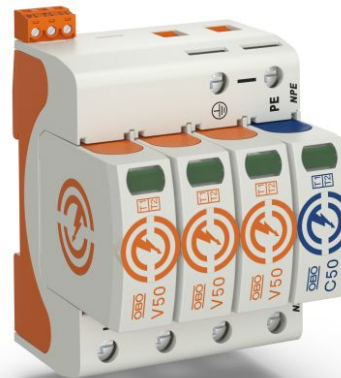
Slika 4. V50-3+NPE+FS-280, št. art. 5093533

V50 je bil razvit za univerzalno uporabo v objektih za zaščito pred strelo I - IV. Skupna zmogljivost praznjenja do 100 kA (25 kA/pol). Odvodniki se uporabljajo v stavbah z zunanjo zaščito pred strelo ali pri nadzemnih električnih napeljavah. Poleg pisarn, poslovnih stavb in stanovanjskih zgradb so te naprave primerne tudi za industrijo.