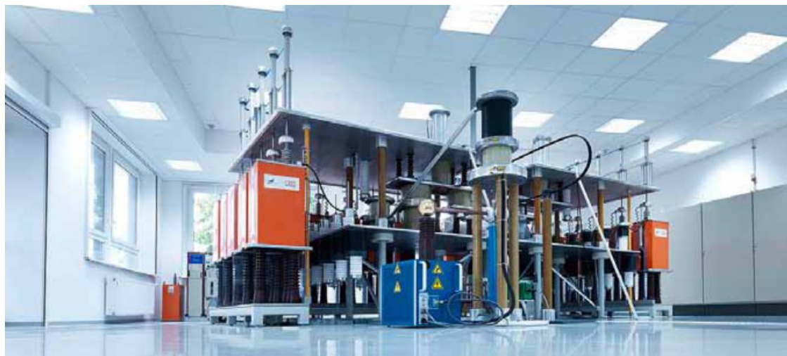
Slika 6. Generator toka strele v BET-centru

V BET-centru , raziskovalnem inštitutu podjetja OBO, potekajo strokovni preizkusi sistema za zaščito pred prenapetostmi in udarci strele. Center preizkuša nove izdelke, spremembe obstoječih