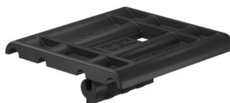
Slika 8. Adapter 165 MBG HGRM, št. art. 5218886

Čas sestavljanja postaja vse pomembnejši pri odločanju za ali proti nakupu izdelka. Z vtičnim adapterjem za mrežne police, OBO predstavlja izdelek, ki nudi prednost pri vgradnji in znatno prihrani čas pri nameščanju mrežnih polic na ravne strehe. Adapter se lahko uporablja na primer pri polaganju fotovoltaičnih instalacij na streho stavbe.